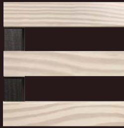
Vernis White Wash Soft