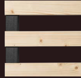
Épicéa (uniquement modèles 9.2)