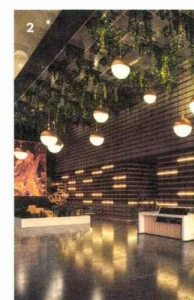
1/ La passerelle piétonne de la Køge Nord Station, au Danemark. Recouverte du chêne verni incolore de la gamme « Linea », de Laudescher, ici mandatée par l'agence danoise Cobe, en collaboration avec Dissing + Weitling. 2/ Les panneaux acoustiques en bois massif de la ligne « Linea Touch » offrent à chaque projet architectural un rendu unique.